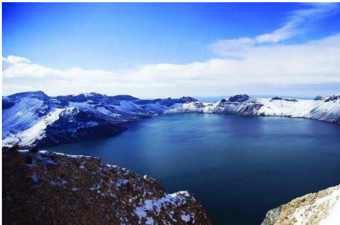
长白山星空———琼宇瑶池，星落华盖